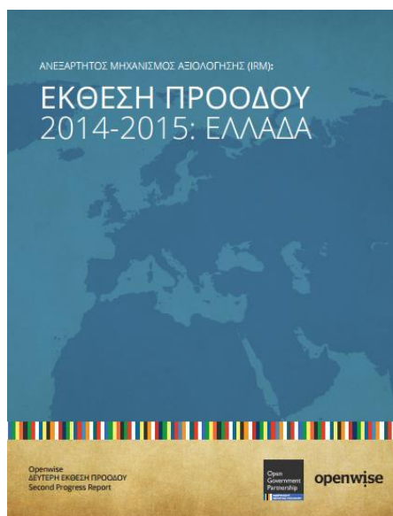
Εικόνα 4 Δεύτερη έκθεση προόδου για την Ελλάδα από τον IRM