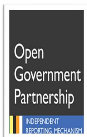
Εικόνα 2 Λογότυπο IRM

Ο IRM είναι διακριτή μονάδα, ο οποίος είναι υπεύθυνος για τα θέματα που αφορούν την αξιολόγηση της ανοικτής διακυβέρνησης.