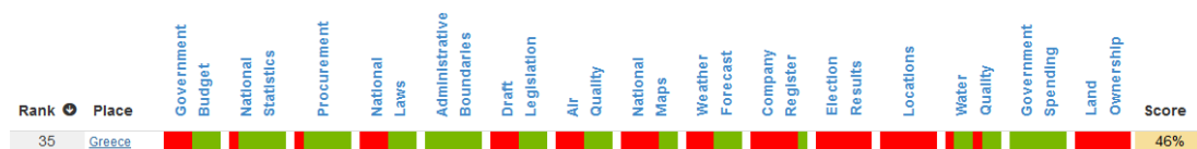
Εικόνα 7 Κριτήρια τα οποία θεωρούνται από το ODRA

Στην επόμενη εικόνα αποτυπώνονται κάποια από τα κριτήρια τα οποία αξιοποιούνται από το ερωτηματολόγιο ODRA [18].