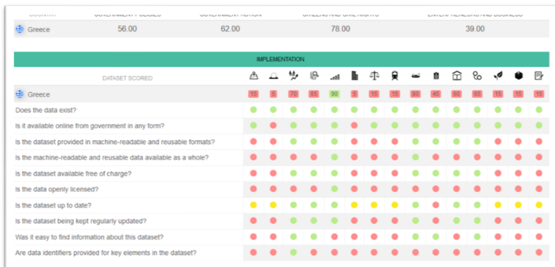
Εικόνα 6 Αξιολόγηση για την Ελλάδα από το Βαρόμετρο για τα ανοικτά δεδομένα

Για την Ελλάδα υπάρχει αναλυτική παρουσίαση των δεδομένων αξιολόγησης ανά κριτήριο, στο πλαίσιο της σχετικής έκθεσης, όπως εμφανίζεται στην επόμενη εικόνα.