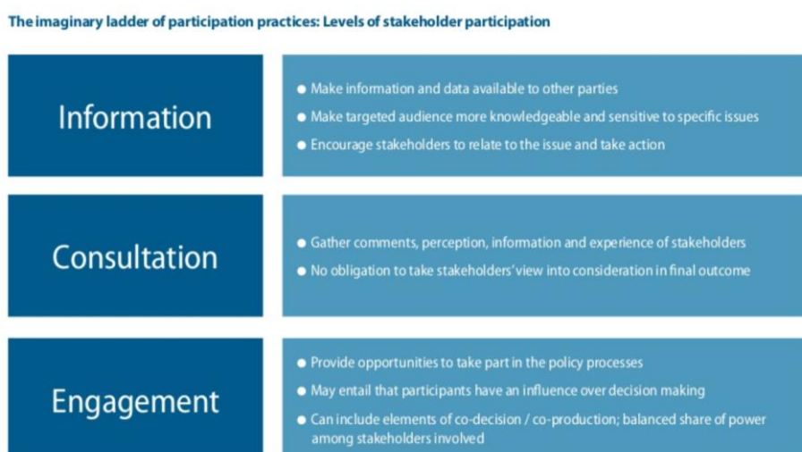
Εικόνα 1: Επίπεδα Δημόσιας Συμμετοχής

Σύμφωνα με τον OECD η συμμετοχή διακρίνεται σε επίπεδα όπως φαίνεται στο παρακάτω σχήμα: