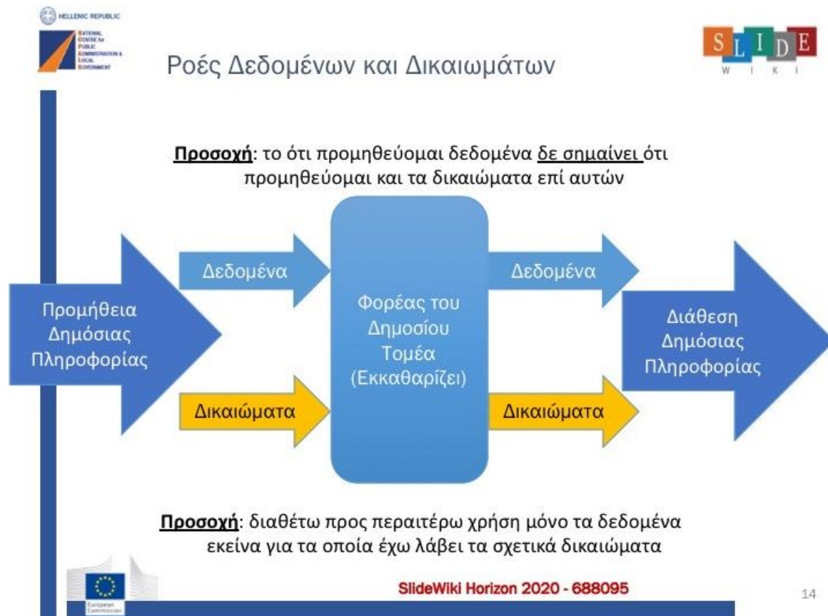
Εικόνα 2: Ροές δεδομένων και δικαιωμάτων

Είναι σημαντικό να τονισθεί ότι τα δικαιώματα και τα δεδομένα δεν ταυτίζονται απαραίτητα. Μπορεί ένας φορέας του δημοσίου τομέα να έχει στη διάθεση του σύνολα δεδομένων για τα οποία δεν έχει λάβει τα απαραίτητα αντίστοιχα δικαιώματα (π.χ. μπορεί να έχει μόνο άδεια τελικής χρήσης και όχι διαμοιρασμού), όπως αποτυπώνεται στο ακόλουθο διάγραμμα.